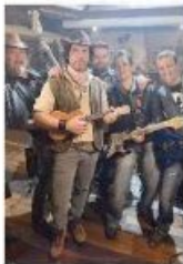
i «Tinta Ma Rock»