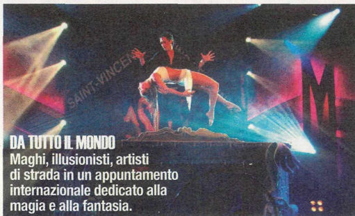
DA TUTTO IL MONDO Maghi, illusionisti, artisti di strada in un appuntamento internazionale dedicato alla magia e alla fantasia.

di strada, illusionisti e attori da ogni dove, che daranno vita al primo festival al mondo che unisce tutte queste varie discipline e che si pone come punto di riferimento per gli appassionati del genere. Se la città diverrà un vero e proprio parco a tema, nel quale ogni attività, dai negozi agli hotel, dai bar ai ristoranti, saranno allestiti in stile fantasy, è innegabile che