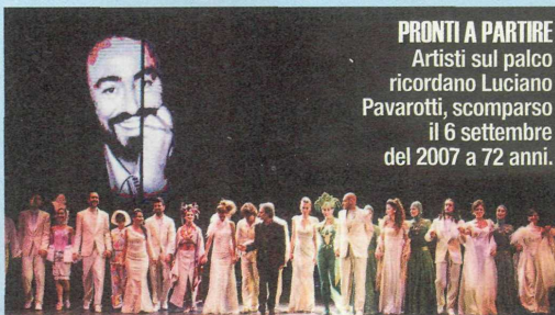
PRONTI A PARTIRE Artisti sul palco ricordano Luciano Pavarotti, scomparso il 6 settembre del 2007 a 72 anni.